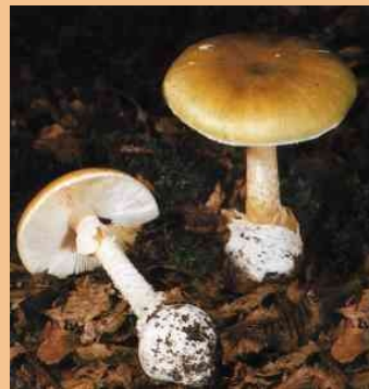
Knollenblätterpilz (Blätter, Lamellen)