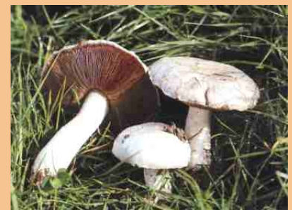
Wiesenchampignon (Blätter, Lamellen)