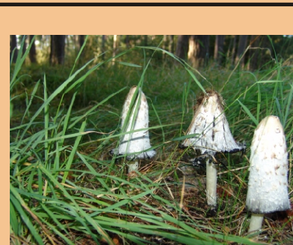
junger Tintling (Lamellen)