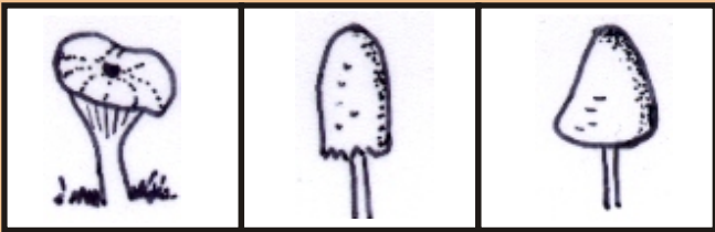
Trichter Walze Glocke