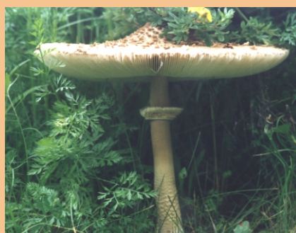
Schirmpilz, Parasol (Lamellen)