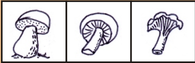
Röhren Lamellen Leisten