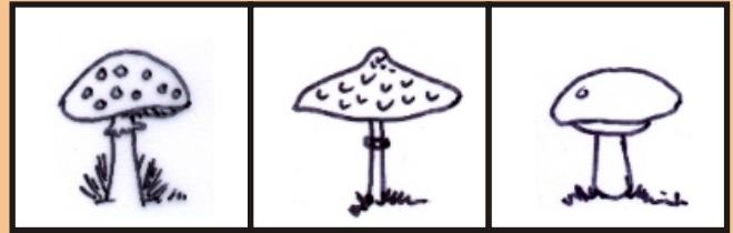
Flocken Schuppen glatt